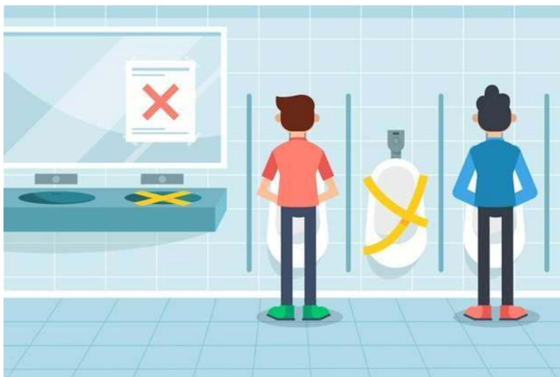
Ejemplo de prácticas para asegurar distanciamiento físico en urinario