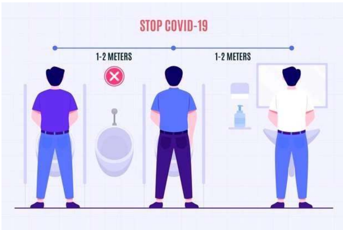
Ejemplo de prácticas para asegurar distanciamiento físico en urinarios