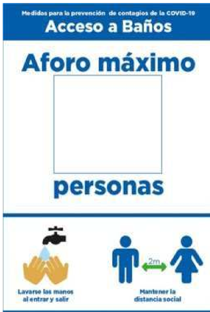
Ejemplo de señalética indicando aforo permitido